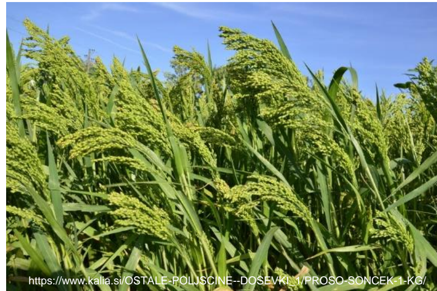
Operacija Lokalne sorte (SOR)

https://www.kalja.si/OSTALE-POLJSCINE--DOSEVKI/1/PROSO-SONCEK-1-KG/