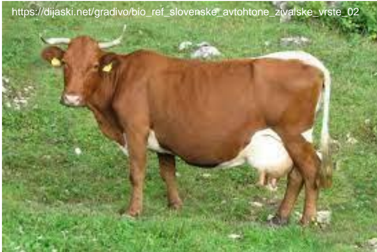
Operacija Lokalne pasme (PAS)

https://dijaski.net/gradivo/bio_ref_slovenske_avtohtone_zivalske_vrste_02